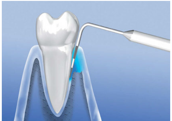
> Parodontitis: Zerstörung von Gewebe und Knochen in der Zahnfleischtasche

Der Übergang von der Gingivitis zur Parodontitis erfolgt schubweise. Die Entzündung erfasst nach und nach alle Teile des Zahnhalteapparates. Das Zahnfleisch löst sich vom Zahn und bildet Taschen, die wiederum Nistplatz für Bakterien sind. Die Taschen werden tiefer, das Zahnfleisch geht zurück, weiterer Gewebe- und schließlich auch Knochenabbau folgen. Der Zahn verliert seinen Halt und wird locker.