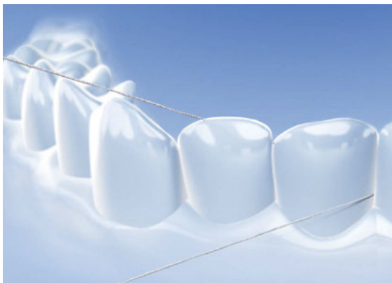
> Zahnseide im Einsatz

Darüber hinaus gilt: Wer die Möglichkeit hat, Stress zu reduzieren, oder es schafft, mit dem Rauchen aufzuhören, senkt nicht nur sein Parodontitisrisiko, sondern gewinnt auch an Lebensqualität.