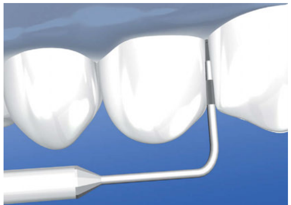
› Untersuchung des Zahnfleisches mit Parodontalsonde

neigungen des Zahnfleisches und die Tiefe von Zahnfleischtaschen festgestellt werden. Die Messergebnisse werden anhand einer Skala (dem Index) bewertet. Zahnfleischtaschen, die tiefer als drei bis vier Millimeter sind, sollten in der Regel behandelt werden.