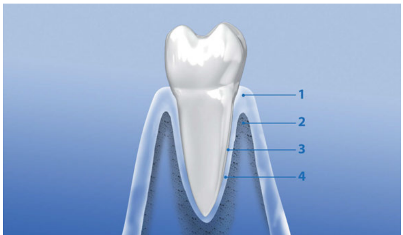
› Aufbau des Zahnhalteapparates

Zwischen Wurzelzement und Alveolarknochen liegt die Wurzelhaut ④, ein Bindegewebe. Seine Fasern greifen auf der einen Seite in das Zement, auf der anderen Seite in die Knochenwand und sorgen so für den elastischen, aber stabilen Halt des Zahnes im Kiefer.